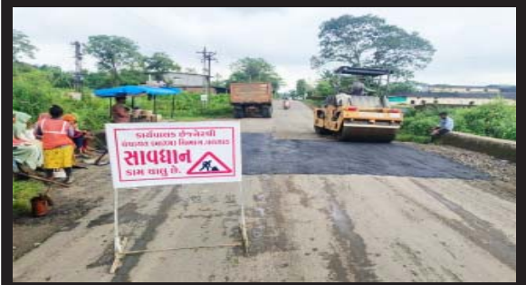
ડામર પેચવર્ક, જંગલ કટીંગ, ગેરં ચૂનો સાથે માર્ગની સપાટી દુસ્ત કરી રાહદારી- વાહન ચાલકો માટે સુગમ બનાવવાઈ રહ્યા છે