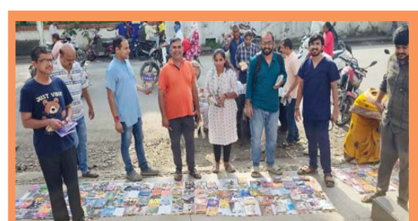
વલસાડ શહેરની બે જાહેર જગ્યા સર્કિટ હાઉસની સામે અને અબામા એસ. ટી. વર્કશોપની સામે કોમા પાસે ફૂટપાથ રવિવારે સવારે યોજાયો