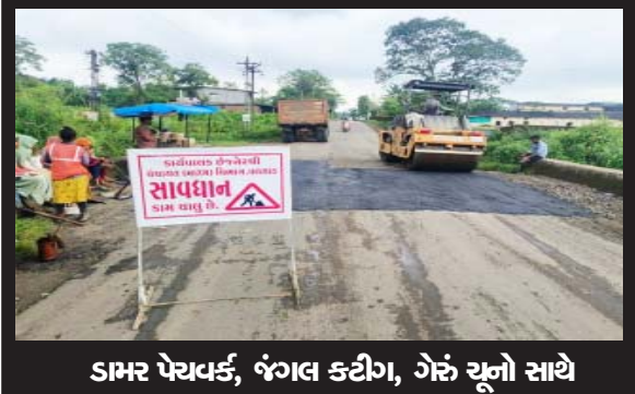
ડામર પેચવર્ક, જંગલ કટીંગ, ગેરં ચૂનો સાથે માર્ગની સપાટી દુસ્ત કરી રાહદારી- વાહન ચાલકો માટે સુગમ બનાવવાઈ રહ્યા છે

વલસાડ, કિરણ પટેલ - વલસાડ જિલ્લામાં ચોમાસા દરમિયાન નુકશાન પામેલા માર્ગોની સુધારણાના કાર્યો તેમજ જંગલ કટીંગ, ગેરં ચૂનો કામગીરી વરસાદે વિરામ લેતા જિલ્લા પંચાયતના માર્ગ અને મકાન વિભાગ દ્વારા હાથ ધરવામાં આવી છે.